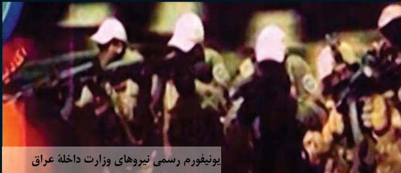
یونیفورم رسمی نیروهای وزارت داخله عراق