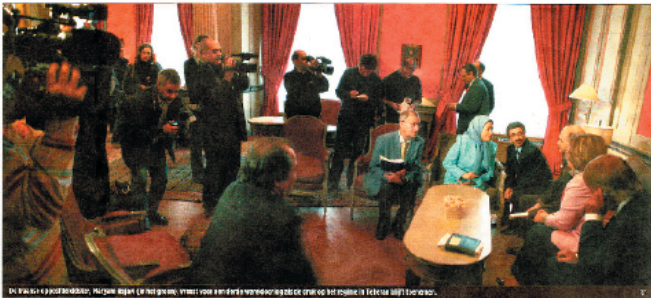
In de foto: Maryam Rajavi, een van de belangrijkste oppositieleidsters, pleit voor meer Europese durf en steun aan Iraans verzet.

■ Het is de laatste week van de Iraanse verkiezingen. Maryam Rajavi, een van de belangrijkste oppositieleidsters, pleit voor meer Europese durf en steun aan Iraans verzet. In een interview voor De Tijd vertelt ze hoe de Iraanse oppositie zich voorbereidt op de verkiezingen van de komende maanden. Dit is de laatste week van de Iraanse verkiezingen. Maryam Rajavi, een van de belangrijkste oppositieleidsters, pleit voor meer Europese durf en steun aan Iraans verzet. In een interview voor De Tijd vertelt ze hoe de Iraanse oppositie zich voorbereidt op de verkiezingen van de komende maanden.