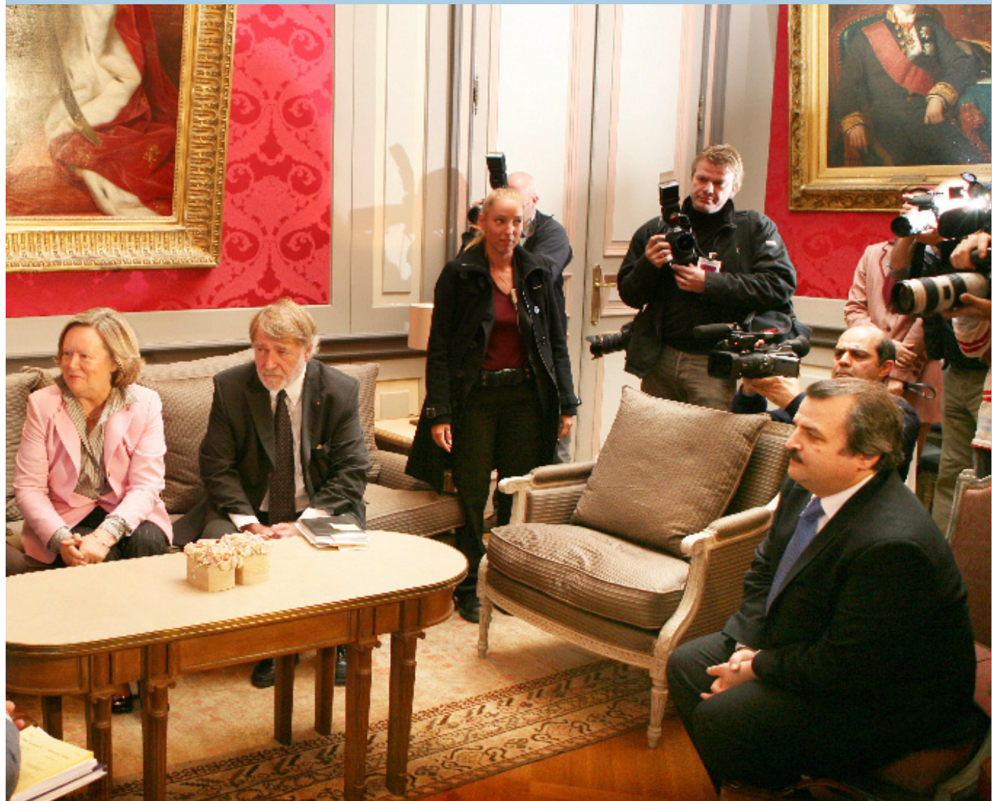
▲ رئیس سنای بلژیک، خانم آن ماری لیزن در تالار معروف به تالار روز که محل ملاقاتهای رسمی رئیس سناست، با خانم رجوی دیدار و گفتگو کرد از راست محمد محدثین: پیرگالاند، آن ماری لیزن، پاتریک وان کرونگلسون، بهزاد نظیری، مریم رجوی، لیونل ون دن برگه

سازش ناپذیر آنها علیه استبداد مذهبی و عزم جزمشان برای تحقق آزادی است.