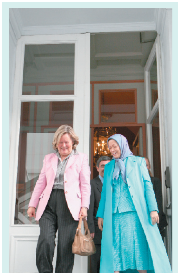
خانم لیزن رئیس‌جمهور برگزیده مقاومت را هنگام خروج از سنا بدرقه می‌کند

روزنامه السیاده ارگان تجمع جمهوری عراق نوشت دیدار خانم مریم رجوی از سنای بلژیک باعث خشم رژیم ایران شد.