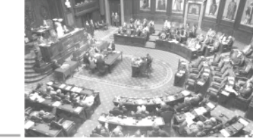
پیشنهاد قطعنامه فرورد خرابیاد سانس برار و ویلفراند خرابیاد

● تصویب این قطعنامه به حلی بود که رژیم آخوندی تلاش گسترده‌ای را بعمل آورد تا با حذف نام مبارزان مجاهدین بلژیک از لیست تروریستی مردم بلژیک و سنا، به‌تصویب آن قطعنامه بنشیند و همچنین نام مبارزان بلژیک را از لیست تروریستی حذف کند. قطعنامه بلژیک در ۲۰۰۵ میلادی به تصویب رسید و در آن زمان، سنا بلژیک از سوی دولت بلژیک به‌عنوان یک سازمان تروریستی اعلام شد. این قطعنامه در ۲۰۰۵ میلادی به تصویب رسید و در آن زمان، سنا بلژیک از سوی دولت بلژیک به‌عنوان یک سازمان تروریستی اعلام شد.