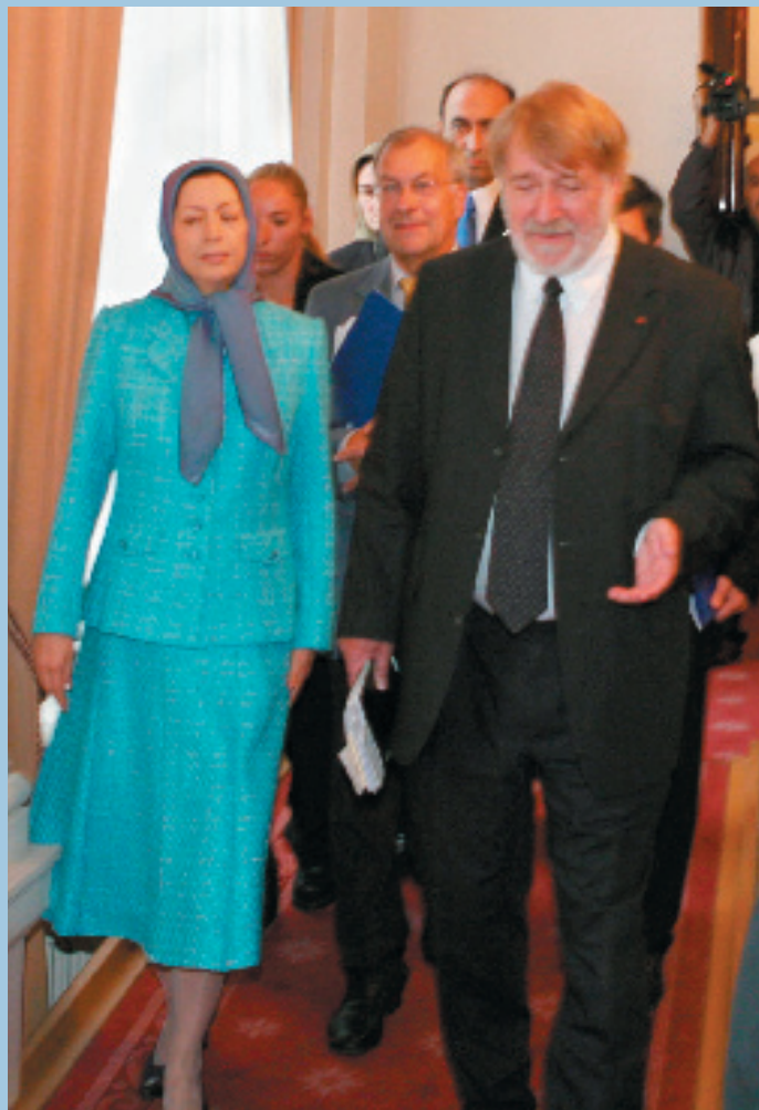
رئیس‌جمهور برگزیده مقاومت به همراه پیر گالاند در سنای بلژیک

عراق و هم‌چنین مواضع روسیه و چین، مانع از اتخاذ یک سیاست قاطع از سوی شورای امنیت ملل متحد خواهد شد. من در دیدار با نمایندگان تأکید کردم که مماشات کشورهای غربی در قبال ملایان چه به‌دلیل منافع اقتصادی و چه به‌دلیل ترس از این رژیم به آنها اجازه داده است که جهان را با یک خطر بزرگ مواجه سازند. و هشدار دادم که کوتاه آمدن در مقابل جاه‌طلبیهای هسته‌یی رژیم، دخالت فزاینده آنها در عراق و جنگ‌افروزی در منطقه، نسخه‌یی برای یک فاجعه است.